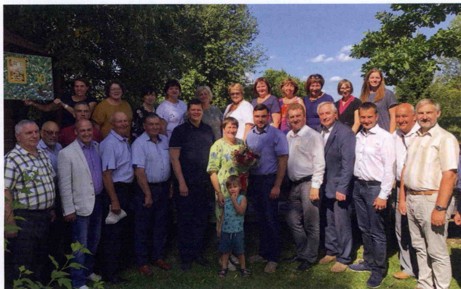
LZF trīsdesmitgadu svētki kopā ar vecbiedriem un viesiem.